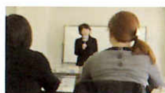
じゅぎょうふうけい 授業風景