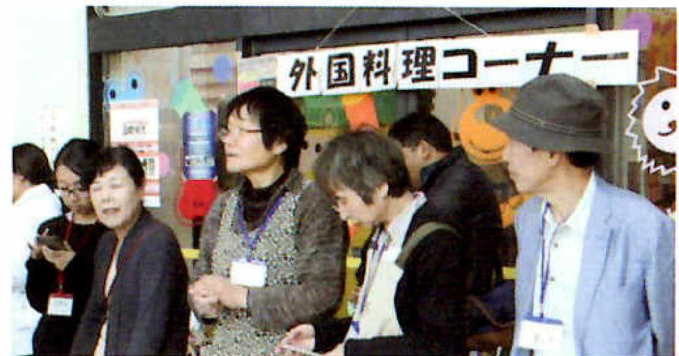
がいこくりょうり かこく 外国料理コーナー (7カ国)