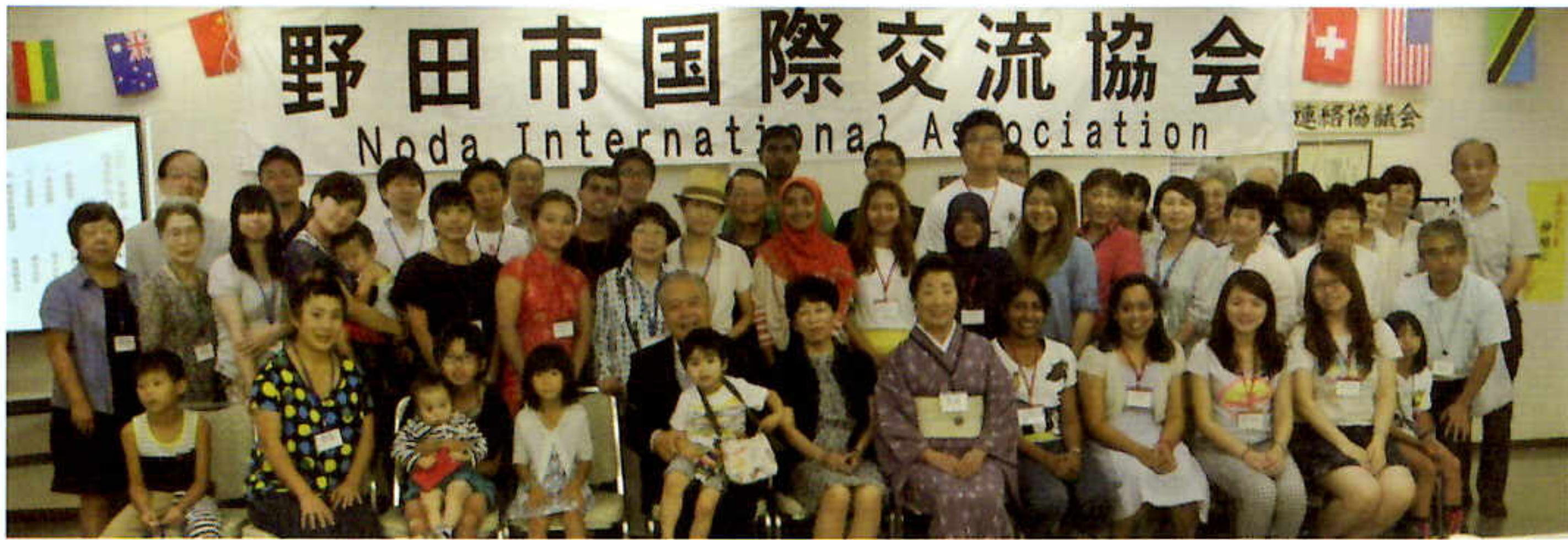
外国人留学生15名 (9カ国) が市内にホームステイ (ホストファミリー: 13家庭)