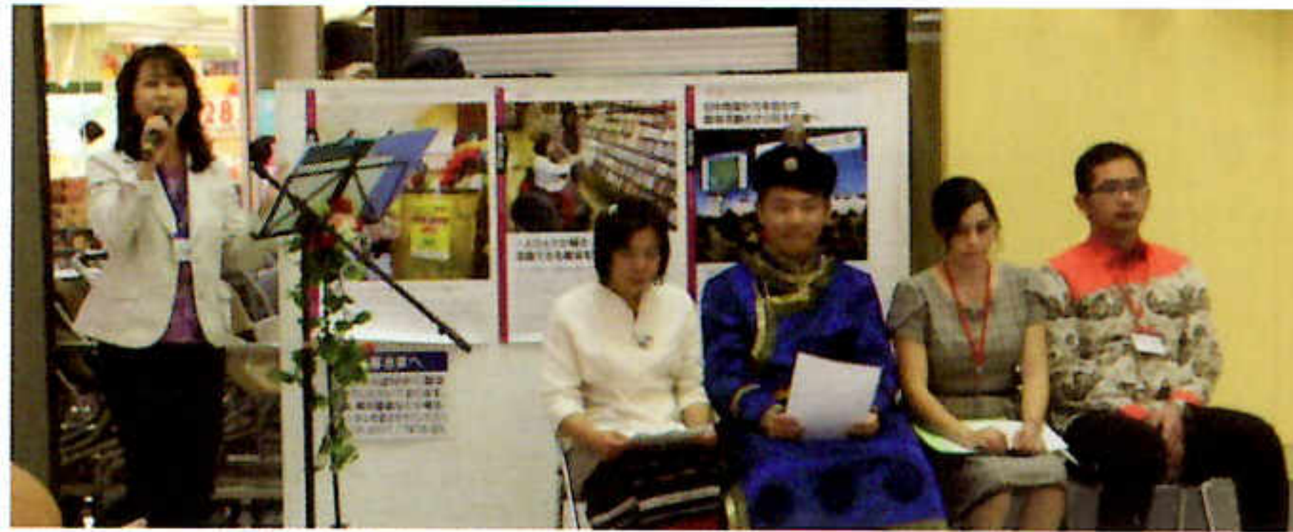
がいこくじん にほんご 外国人による日本語スピーチ