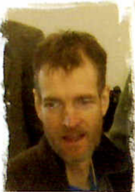
えいごこうぎ 英語講座