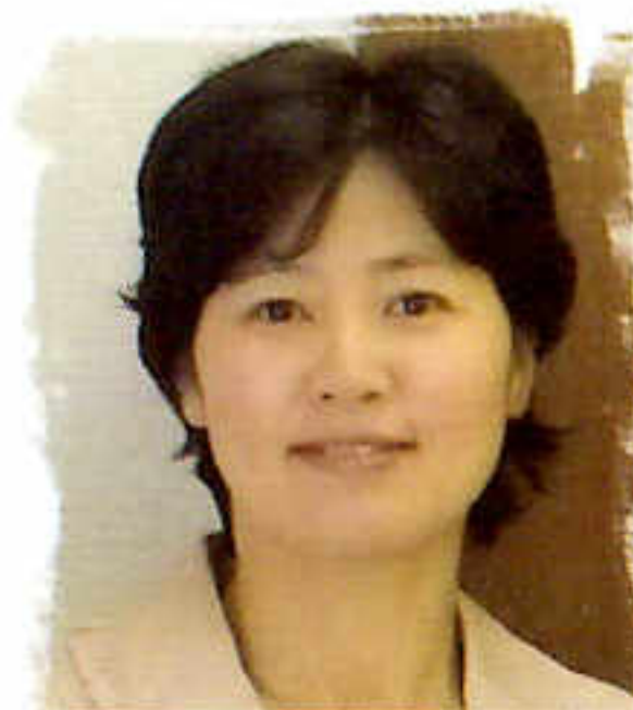
ちゅうこくごこうぎ 中国語講座