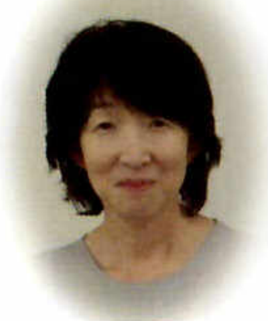
かんこくごこうぎ 韓国語講座