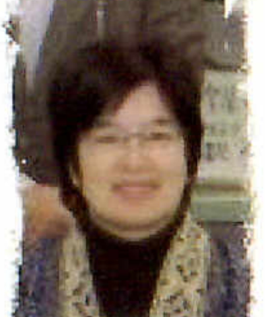
ごこうぎ タイ語講座